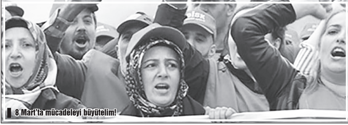
8 Mart'ta mücadeleyi büyütelim!

Öyle bir noktadayız ki sessizliğe bürünmeyi sürdürdükçe soframızda açlık derinleşecek, hanemizde şiddet boyutlanacak, ülkede karanlık zifiri hale gelecektir. Patronlar da her adımda onları koruyan ve kollayan devlet de her şeyi kendine fırsata çeviriyorlar. Krizle debelenen sermaye yükü omuzlarımıza atmaya başlamıştı ki pandemi ile yıllardır oturtmaya çalıştıkları çalışma biçimlerini normalleştirmenin adımlarını sıklaştırdı. Her çıkan karar ile her yasa ile sermaye güvenceye alınmaya çalışılıyor. Devletin pandemi önlemlerini açıklıyoruz dediğinde karşımıza kısa çalışma, ücretsiz izin çıkıyor; İşsizlik Fonu'ndan yani biz işçilere kendi cebimizden kendi ücretlerimizi ödettiriyorlar. Telafi çalışma süresi arttırılıyor, esnek çalışma biçimleri kalıcılaştırılmaya çalışılıyor. İşten atma yasak denilerek patronlara kod-29'dan yani madde 25/2'den tazminatsız atmasının önünü açıyor; haklarımız böyle de gasp ediliyor bir de gösterilen işten atılma nedeni ile onurumuz kırılıyor. Patronların vergi borcu siliniyor, teşvikler sunuluyor. Bizler bu tabloda hem iş hem de gelir güvencesinden yoksunlaşıyoruz. Elbette en önce ve en çok etkilenen kadın işçiler oluyor. Pandeminin getirdiği koşullar ve yaşam biçimi şiddeti arttırdı. Kadın